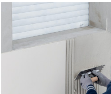
Εφαρμογή κεραμικών πλακιδίων μεγάλων διαστάσεων