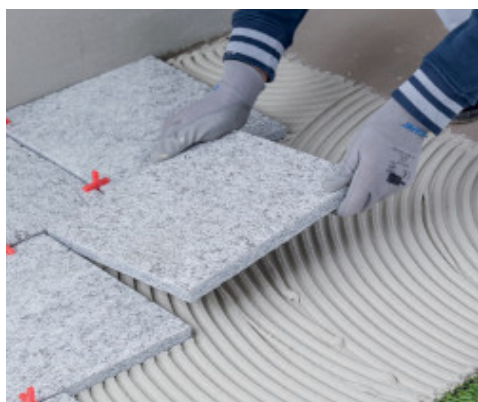
Εφαρμογή φυσικών λίθων σε εξωτερικούς χώρους

Για σημειακή συγκόλληση ηχομονωτικών ή μονωτικών πλακών εφαρμόστε την Keraflex Maxi S1 με σπάτουλα ή μυστρί στο πάχος που απαιτείται, ανάλογα με την επιπεδότητα των επιφανειών και το βάρος των μονωτικών πλακών.