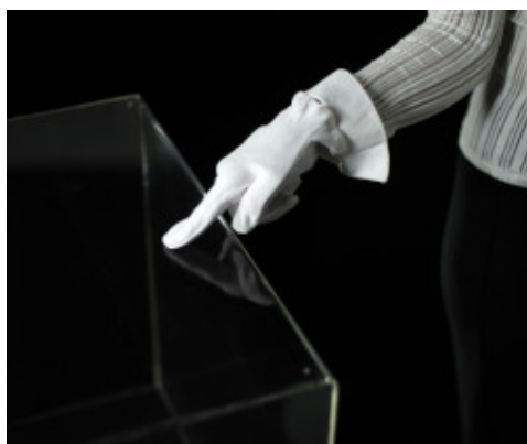
Με προϊόν Low Dust (χαμηλή απελευθέρωση σκόνης)